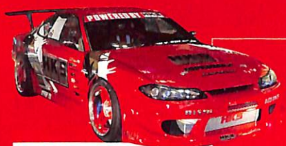
エッチ・ケー・エス