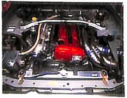
ツクバ仕様のまま、市街地初走行!