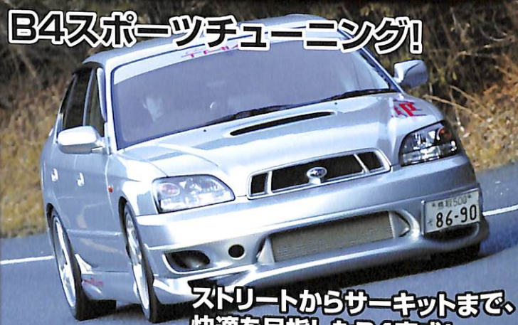
B4スポーツチューニング!