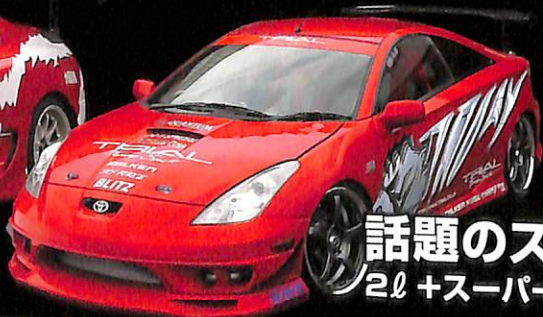
話題のスーパーセリカ 2.0 +スーパーチャージャーの魅力!