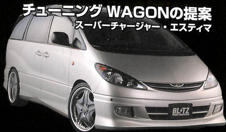
チューニング WAGONの提案 スーパーチャージャー・エスティマ