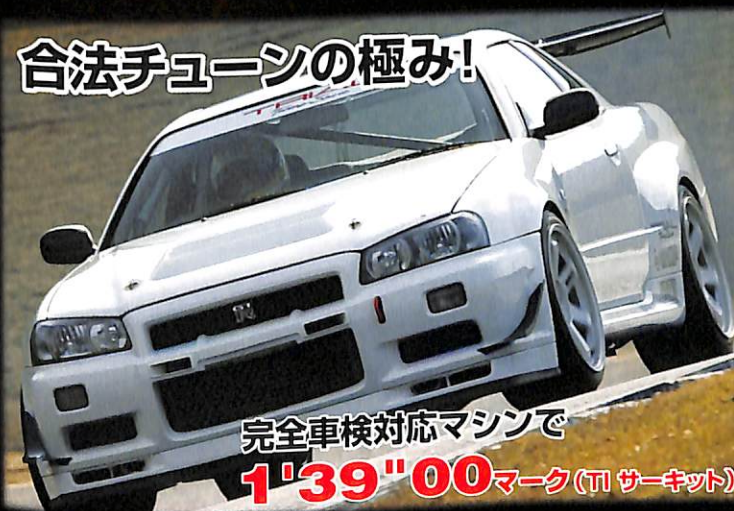
合法チューンの極み!