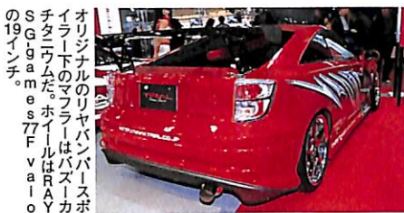
オリジナルのリヤバンパースポイラー下のマフラーはバスーカチタワムだ。ホイールはRAYSG-games77Fvaioの19インチ。

●エクステリア：TRY-FORCEエアロキット ●エンジン：トリアル T3ZZ2Lキット/ブリッツコンプレッサーシステム/APEXiパワーFC ●足回り：QUANTUMプロトタイプ ●ホイール：RAYS G-games77W vaio (19inch)