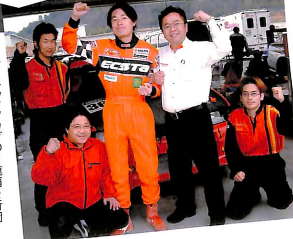
「最近、記録狙いのなことをしなかったんやけど、今年は直球勝負の年にしようと思ってるねん。だから今回もRを持ち込んで、徹底的にリメイクしてきたんよ。このクルマ、まだまだ速うなりそうなんや、今年のトライアルに期待したってくださいな!! (代表、マツキ一牧)」