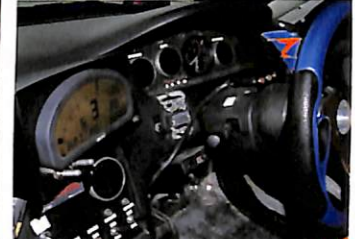
エンジンや各部の温度はもちろん、サスペンションストロークやアクセル開度、ブレーキングまでデータ化して、走り解析。カンだけに頼らずデータに基づいたセッティングで確実な速さを手にしている。

■TUNING SPEC■ RB26改2.8ℓ (700ps) T51R・KAI・BB 最大ブースト圧1.5kg/cm 2 HKS・V-camキット (IN/EX:272度) / FコンVプロ/6速ミッション/EVC-Pro MoTeCダッシュロガーシステム インフィニティ用シングルスロットル クァンタム・トライアルバージョン車高調 エンドレスブレーキキャリパー アドバンA048 (F/R 265/35-18) ほか