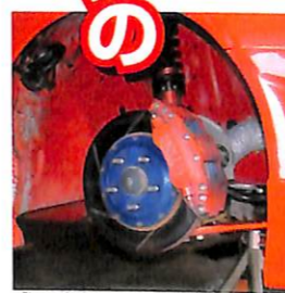
ブレーキキャリパーはエンドレス製。また、キャリパーに導風することで、フェードを防いでいるのがわかるかな。まかなことの積み重ねで、安定した速さも狙っているんだ。

オーテックツカダの6連覇を断固阻止すべく、本気でマシンを仕上げたワダQというのがトライアル。デモカーのBNR33は今回に向けて仕様変更がなされ、新しい試みも盛り込まれている。 たとえば、エンジン。HKSの2.8ℓキットに組み合わされたヘッドには、可変バルタイシステムのVカムが組み合わされ、チューンドRB26の弱点といわれていた低回転のたつきを克服。また、まだテスト段階というだけで、決勝時にははずしてしまっただけで、フロアにアンダーカバーを製作し、