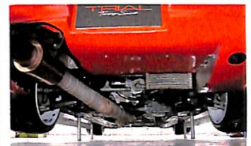
決勝時にははずしてしまっただけで、アンダーパネルを用意して、床下の空気にしても本格的にテストしているようす。今回用意したフラットパネルは、走行風を駆動系に導なかつたため各部の油温を安定させられなかったそう。