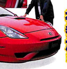
ベストタイム：2分19秒762

DRIVER'S COMMENT 昨はそれなりに走っていたつもりですが、4速全開からフルブレーキなんてサーキットならではのですね。ヒョッキで早くブレーキ踏みすぎて、途中で1回加速したくらいかな。慣れが1周半に伸びてしまいました。もっと楽しみたいのでハマリそうです。