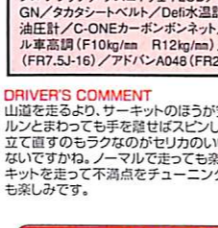
ベストタイム：2分06秒615

DRIVER'S COMMENT 山道を走るより、サーキットのほうが安全です。クルンとまわって手も離せばスピードは止まるし、立て直すのもラクなのがセリカのいいところじゃないですかね。ノーマルで走っても楽しいし、サーキットを走って不満点をチェックしていくのも楽しみです。