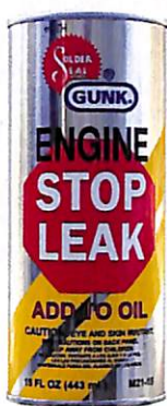
◀エンジンストップブリーク