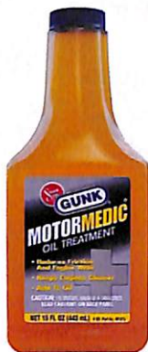
◀モーターメデック