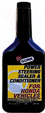
◀パワーステアリング