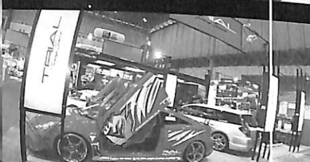
T3ZZ ENGINE in LOTUS EXIGE