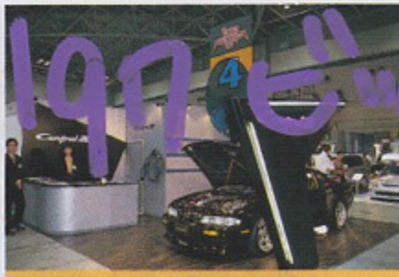
セントラル20 セントラル ☎0424-86-4451