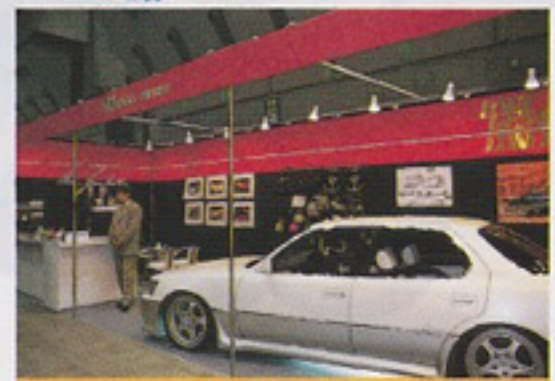
ゲンバラ ゲンバラファースト ☎03-5722-8745