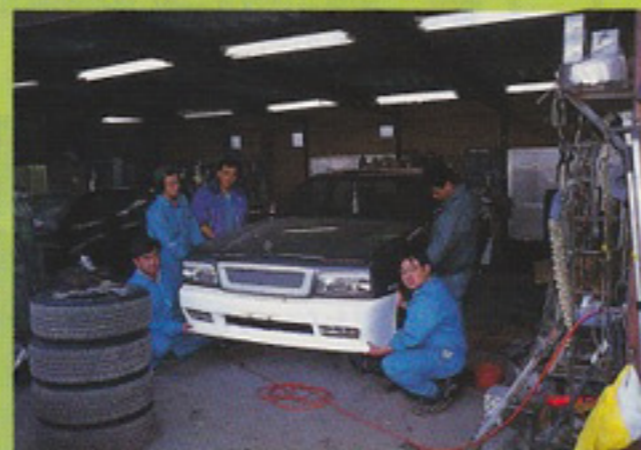
ショップの外観はちょっとくたびれている けど、腕の方は確かだから、心配無用「自社メ ンテナンスで富士フレッシュマンレースに参 戦中なので、みんな応援してね」だって!