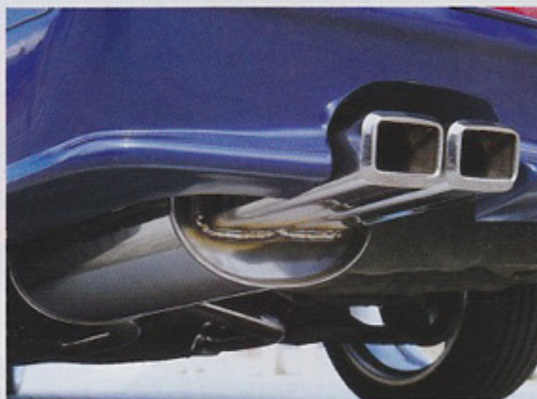
サブマフラーの後ろから換える、リヤマフラータイプ。 もちろん、交換も楽だし、いざとなればノーマルに戻 せる気軽さもマル。

ちなみに、サウンドは意外にジェ ントル。ノーマルとは明らかに違う重厚 な音だが、聞き比べなきゃ交換したと は思わないかも。エアロのイメージか らするとちょっと迫力を想像していたが、 これは、あくまでも優雅に乗る、と言 うコンセプトの現れだろう。