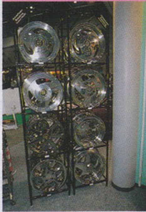
←アメリカンテイストたっぷりのAHPホイール。クルマはレジェンド。 ↑セダンのドレスアップにも相性良いのホイールが揃っているA.R.