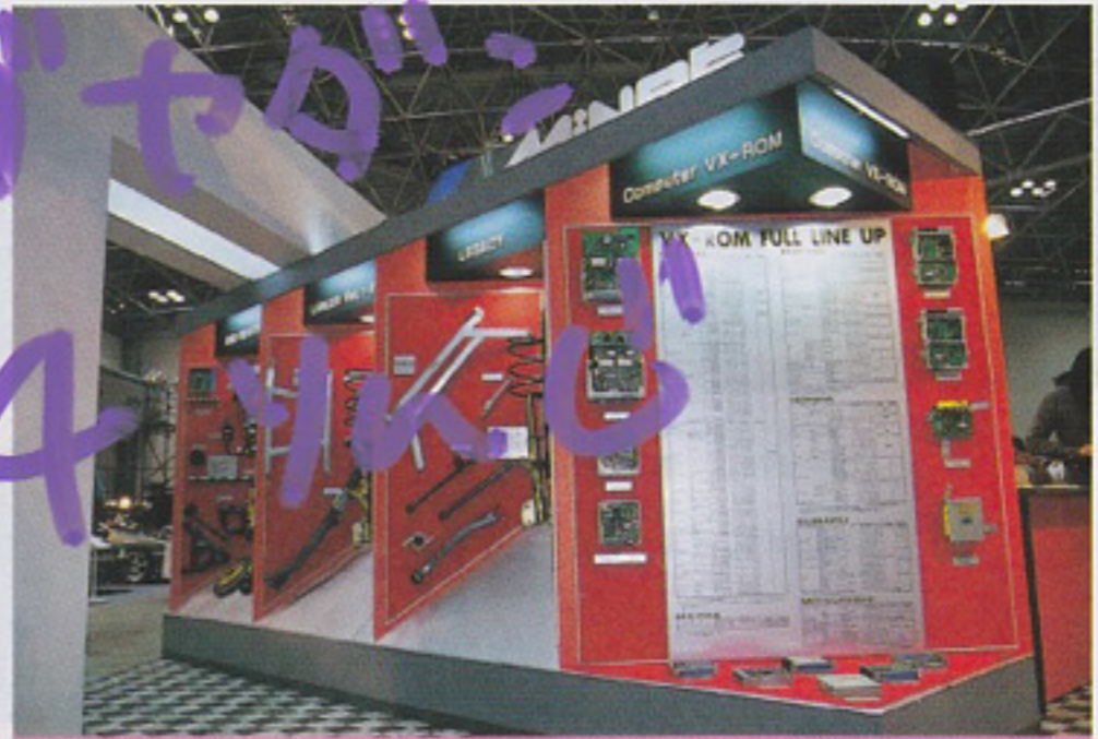
マインズ マインズ・ウェイブ ☎0468-57-3313