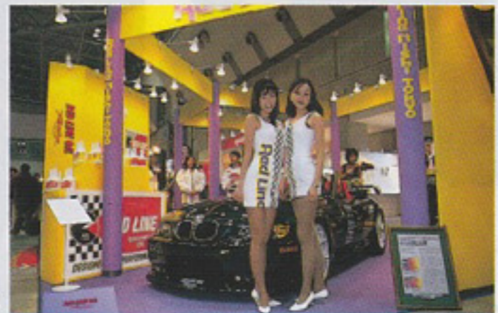
レッドライン レッドライン西東京 ☎0424-66-8197