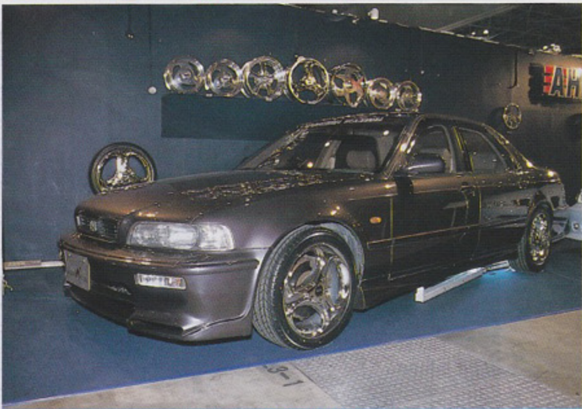
ウッドペル カロツェリアウッドペル ☎045-541-1881