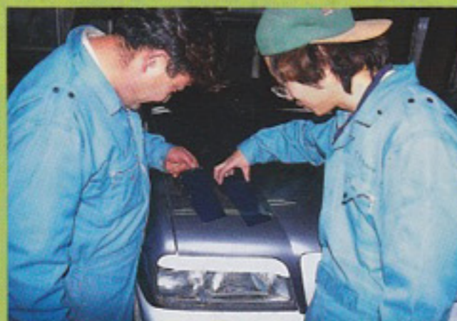
ユーザーと相談しながらオリジナルカラーを ミキシングして行くのも楽しみのひとつだ うだ。

協力感謝：カーチェイス 〒594 大阪府和泉市富秋 町2-1 ☎0725-31-2222/アドバンス 〒224 神奈 川県横浜市都筑区長坂1-41 グランヴェル平台1F ☎ 045-943-5901/アドミレイション 〒146 東京都大 田区千鳥2-1-10 ☎03-3757-3380/エポリューション /オートランドム/ジャンクション/TMC 〒561 大阪府豊中市利倉3-6-17 ☎06-866-1431/トライ アルプロジェクト 〒238-03 大阪府堺市八下町4- 102-9 ☎0722-54-9777/TMリペアショップ/豊田 通商カーアクセサリ事業部/バトルクラブ 〒216 神奈川県川崎市宮前区小台1-10-23 ☎044-856- 1031/マイズ 〒238-03 神奈川県横須賀市林5- 7-25 ☎0468-57-3313/横浜ゴム 〒105 東京都 港区新橋5-36-11 ☎03-5400-4532/ル・モンドE& Gクラシックス事業部/ワイズ 〒228 神奈川県相 模原市上鶴間545-5 ☎0427-40-2800 (順不同)