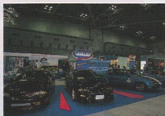
トヨタ トヨタ自動車 ☎03-3717-9123