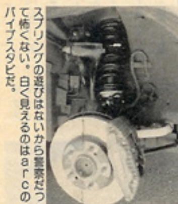
スプリングの遊びはないから驚きだつ て怖くない。目々見えるのはarcの ハイプスだ。