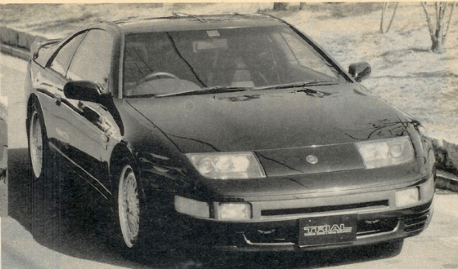
ハットは新発売のアベック ス製をチヨイス。コントロ ール性などが魅力という。