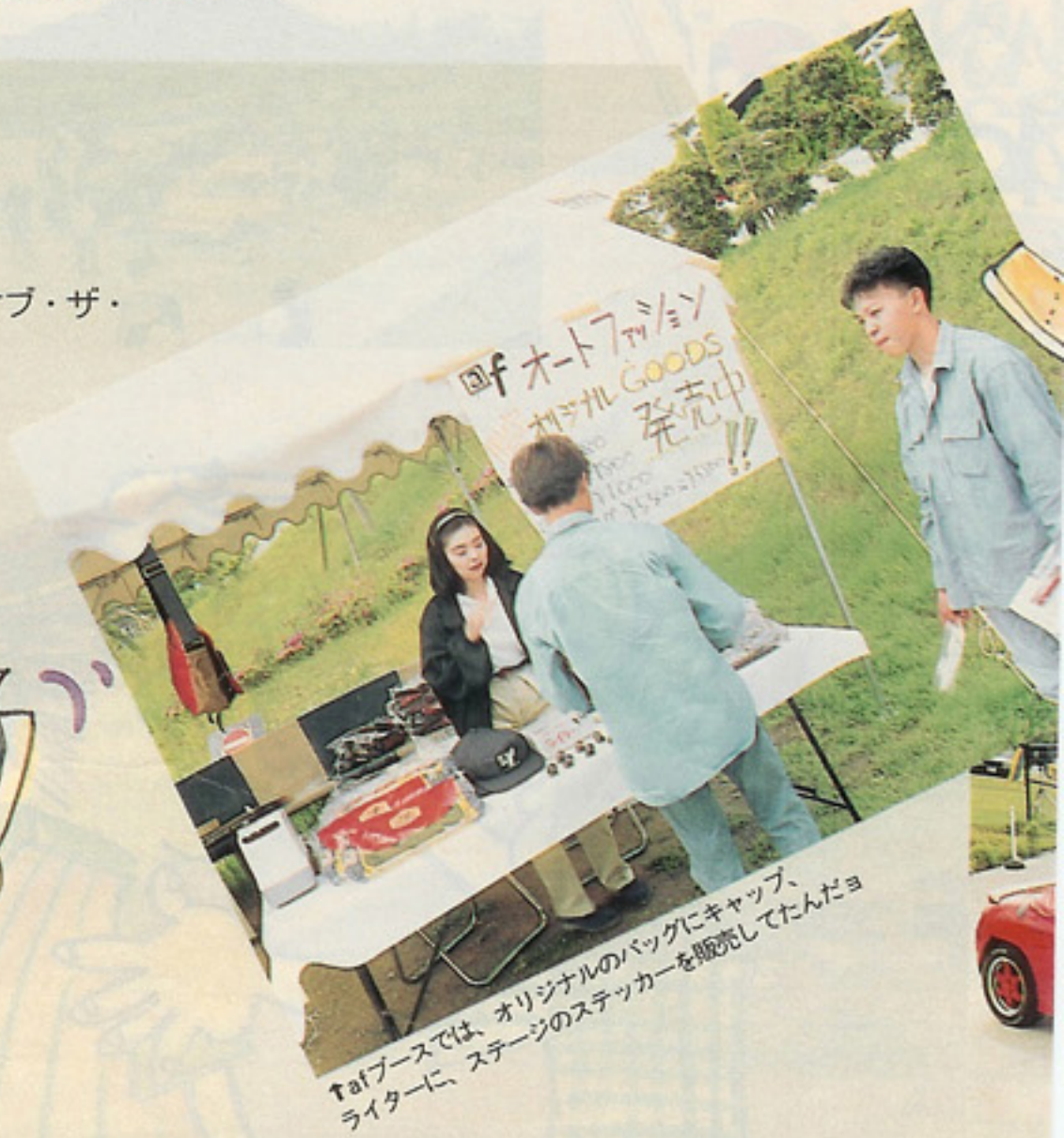
Tafブースでは、オリジナルのバッグにキャップ、ライターに、ステージのステッカーを販売してたんだヨ