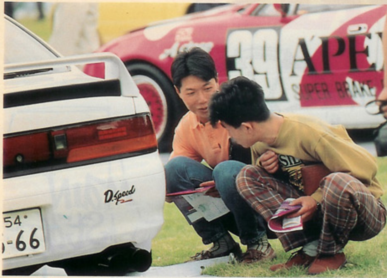
↑1人で来ている人も、ちょっとしたキッカケで友達を作ってしまう。afはそんな空間をキミへ提供