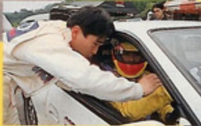
呼ばれてないのに来る男サイト一編は、実は瑞浪初体験なのだ。

最近、サンデーレースの耐久がブームのようだぜ。 普通のスプリントより走れる時間が長いってのがウケている理由だろうな。どーせ何万円かのエントリーフィー(参加料)を払って出場するんだから走る時間が長いほど得した気になるもんね。それともうひとつ、車の差だけでは勝てないってのが耐久レースがおもしろい理由だと思う。車やパーツの耐久性、ドライバーの体力、そして燃費など、勝敗をわけるファクターがすくなくたくさんあるからだ。