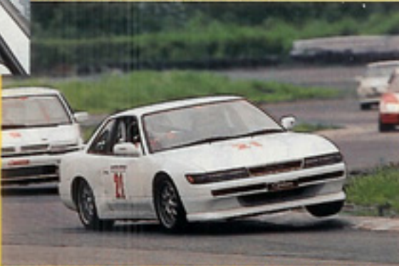
マッキーもOPTチームに参加。豪快な走りを見せる!