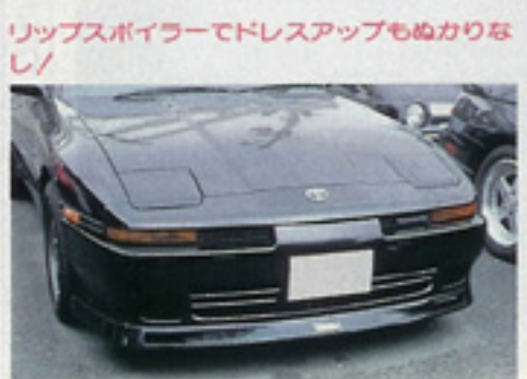
アベックスマフラーからは結構いい音がするんだけど、捕まったことはなし。