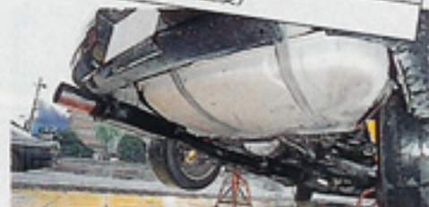
5ZIGENマフラーはパイプ径80φ、出口100φ。効率優先の選択だから当然、車検「非」対応だ。

う周囲の声を無視して入れたツインプレートも見栄やハッタリではなく、コイツのパワー(350ps)をアスファルトに炸裂させるために絶対に必要だったのだ。 「女の子だってその気になればこまでやっちゃうんだから(標準語に訳したがホントは大阪弁)と語る彼女はバリバリゼロヨンギャルなのだ。