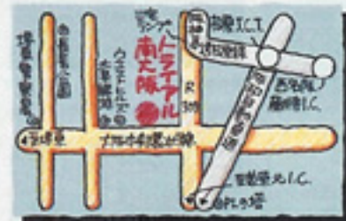
ガイド：阪神高速から行く。まず三宅インターで降りて、R309を南下する。丹南西交差点で右折して大阪中央環状線に入る。ちょっと行くと右側にトライアル南大阪店が現れる。大阪中央環状線沿いになる。