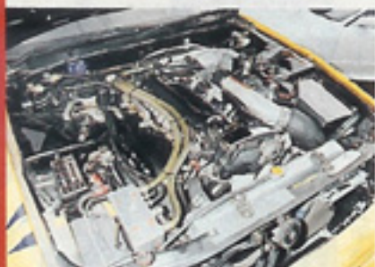
とにかくGT-Rのチューンにはノウハウがいっぱい。横れずハイパーなエンジンを作ってくれる。