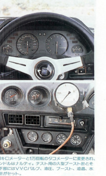
300キロメーターと1万回転のタコメーターに置き換え、ハイトもより北の。テスト用購入車アース・社と社との下部にはVVC/バルブ、ポンプ、ブースト、油流、水漏計がセット。

カウルは12点キッパで価格が万円。S1 30Zの直月が倍増する。この場合、本格的なチャレンジはこれからだが、新たなライバルも登場。光栄パンテラより速い307km/hの白を記録した西のトライアルZも、RSやモトモラ、ストも300km/hの大白に乗った。ARRの直線が発表されるが興味深い。