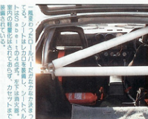
★ABRフェアレディZツインターボ

性能も重要だがストリートでは外観のカッコ良さも重要。価格感を抑えたFノーズ、CD値を考慮されたスーパーフェンダーにはレザリング・カラーを施しあさらせる。ボンネットは未完成のため多回塗装されている。