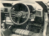
250km/hオーバーカーとは思えないくらい速りのインテリ。