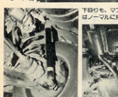
サスペンションはトラスティンター製のもので変更してサスペンションを走行することができた。

エンジン：83x65mm 2750cc アリアス新製ピストン 三菱製T-D 06タービン×2 大容量ウエストゲート トラスト大型インタークーラー 補助インジェクター3本 定数のトラスト製サスペンションキット エアロパーツ：F:フロント純正 R:フロントエアロ