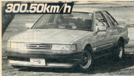
あまりにもおもしろいボディメーンにまでヒック。