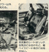
本装載のシートはリッチな気分にはなれず、超ハイスピード走行には堪えられない。

エンジン：83x65mm 2750cc アリアス新製ピストン 三菱製T-D 06タービン×2 大容量ウエストゲート トラスト大型インタークーラー 補助インジェクター3本 定数のトラスト製サスペンションキット エアロパーツ：F:フロント純正 R:フロントエアロ