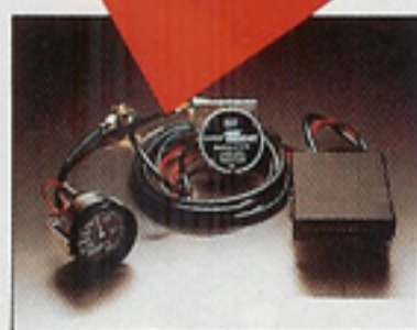
F-14戦闘機仕様 TURBO METER

SKターボメーターは正確さと夜間の確認性にすぐれたF-14戦闘機と同一仕様。+1.5kg/cm 2 -760mmHgまで表示。ターボコンディションを忠実にドライバーに発信します。