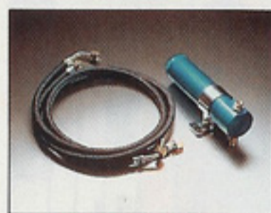
ターボ熱に特効薬 T.M.C.

ドライバー不在のままアフターアイドルリングをつける不安を解消。イグニッションオフで作動するセルフクーリング。60°C前後に冷却したオイルでターボチャージャーを安全温度まで引き下げます。純正ターボ車もOK。装着車種の巾をワイドに広げました。