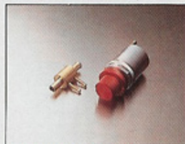
運転席から調整可 B.C.V.

ドライバーズシートから最適なチャージ圧をコントロール。チャージ圧を確保するブーストキーパーダイヤル内包の親切設計です。