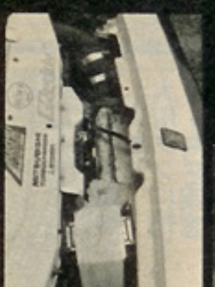
▲CDとインタークーラ ーはもちろん装着