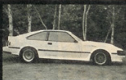
▲トラストのSステッ プがサイドのポイント うのがひと目でわかる