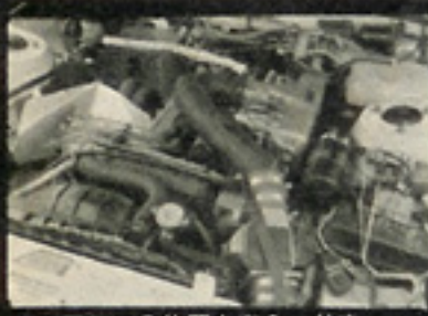
▲エアフロの位置を変え、効率 を良くしている