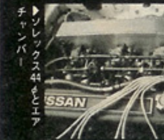
▶ソレックス44φとエア チャンバー