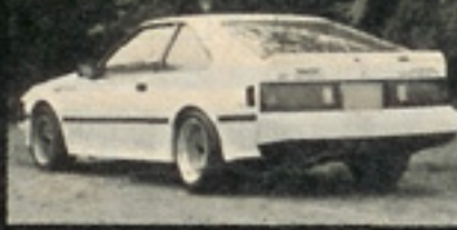
▲タイヤのタツバが違 うのがひと目でわかる