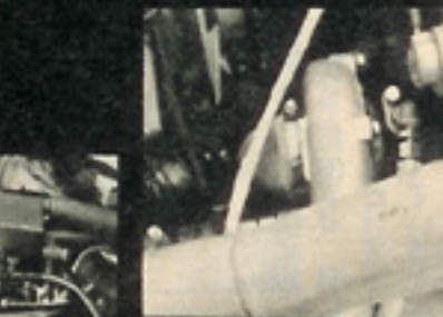
▲タービンはT O - 4がツ インで装着されている