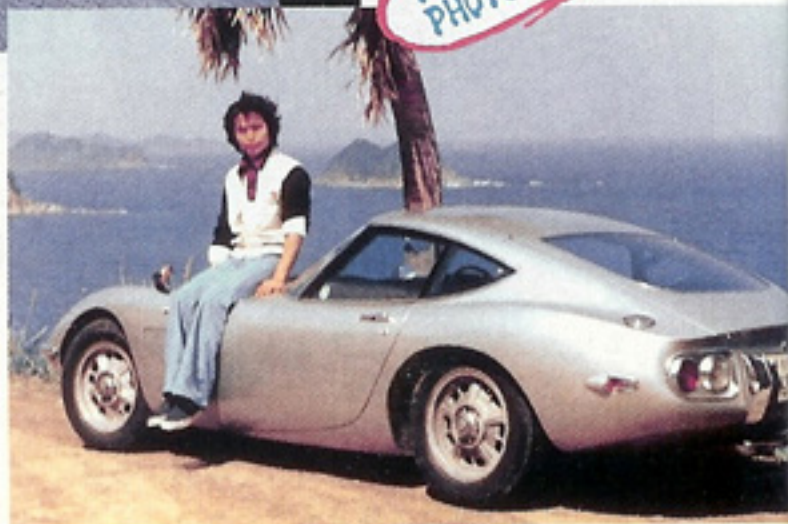
20歳の時、トヨタ2000GTでハネムーン旅行

今でこそ俺にとったらオーバー300km/hなんて簡単なことやけど、他の者がやったらそうはいかへん。みんな頭の中でパワーだけを計算して簡単に出せると思とる。そんなもんじゃない、俺はみんなの知らん所で人一倍努力して誰にも負けへんターボのノウハウをつかんだつもりや。