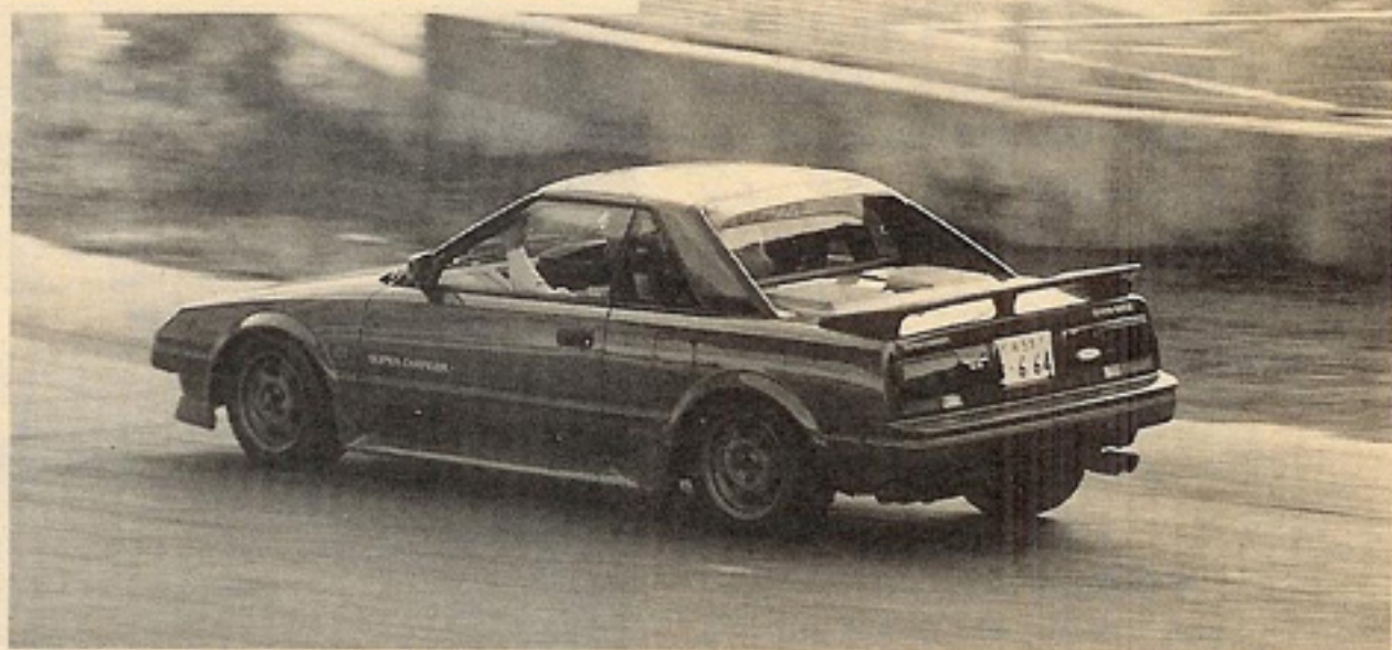
●チューニング・データ MR2スーパーチャージャー Gリミテッド・Tバールーフ(61 YEARS)

今回テストしたMR2スーパーチャージャーは、あくまでもノーマル。ただし、トライアルによるエンジンアナライザーチューニング（点火系、インジェクター系のベストセッティング）と、カムタイミングの変更で高回転域でのシャープな伸びを確保