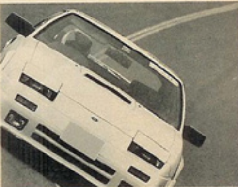
RBオーナーならF-1にまず相談！

RB20DET搭載のフェアレディ200ZRのオーナーはチューニング見積りを無料で行なってくれる。予算や自分の走りの好みに合わせてF-1のスタッフに相談できる絶好のチャンスといえる。ノーマルで乗ってたってこれ以上速くならないからネ。