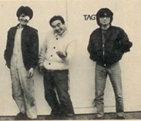
スタッフ一同待ってるよ！

は、女の子キャビキャビのバブ、ぶすっ子クラブ新宿店の2000円でOKの優待券をプレゼントしてくれる。期間は券が無くなり次第。ただし、ブーストアップしたクルマで飲みに行くこと飲酒運転になるのでお気を付け下さいとの話。