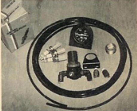
車種により3万3100~3万7300円のキットだ