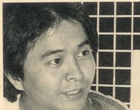
苦悩の牧原店長、次の犠牲者は誰だ！

大阪府東大阪市茨江780-1 ☎0729(65)6823 営業時間AM11:00~PM7:00 定休日・火曜日