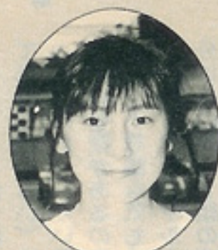
アイちゃん 職業=忍者

使うマシンの種類によってスリックカー、プロトラックと呼び方が変わるが、プロトラックの方が概して高速型なのだ。この遊び、関東でも板橋などにあつたりするが、数は関西の方が圧倒的に上。週激に流行中なのだ