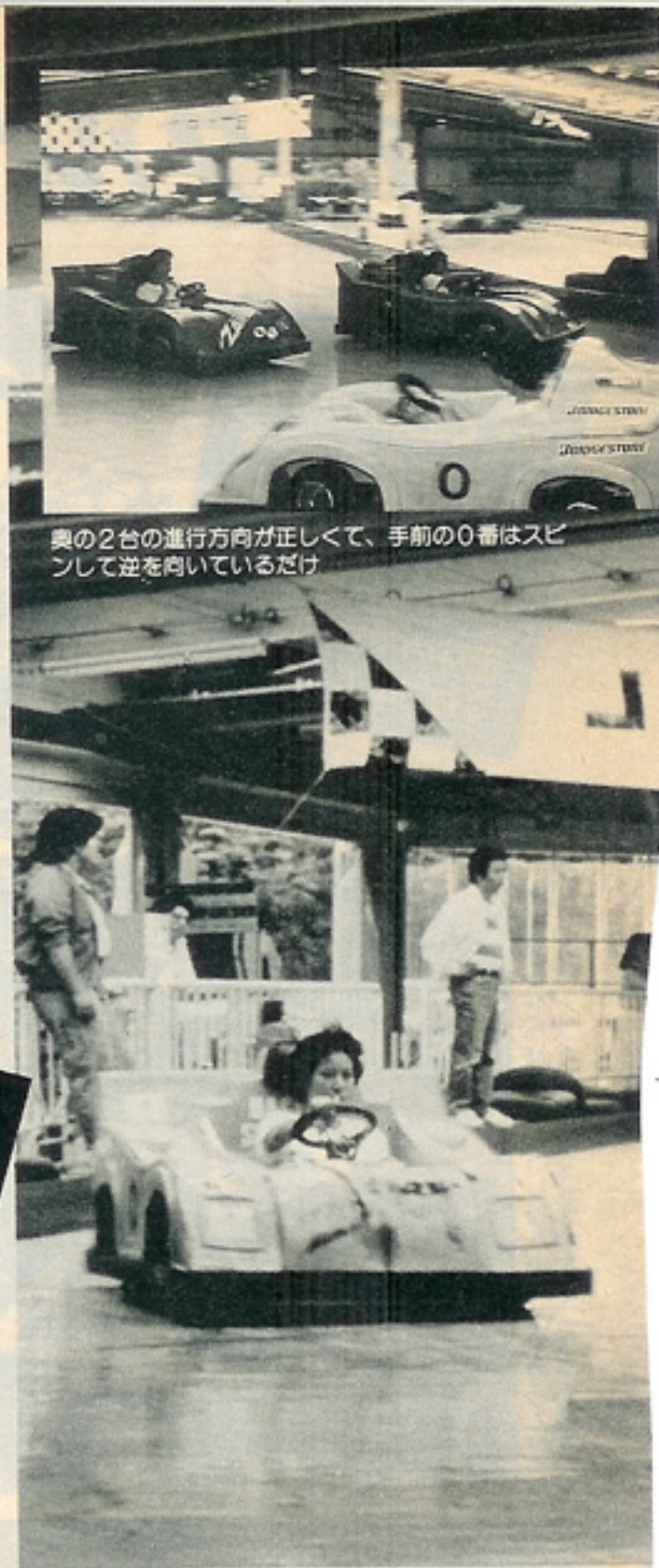
奥の2台の進行方向が正しくて、手前の0番はスピンして逆を向いているだけ

※なお、ちゃめっこクラブとは大阪で組織されているギャルだけのレーシングチームである。入会希望者は0729(65)6823トライアル内の事務局まで問い合わせを!