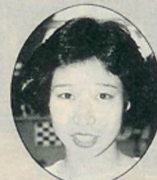
カヨちゃん 正体=ナイチンゲール