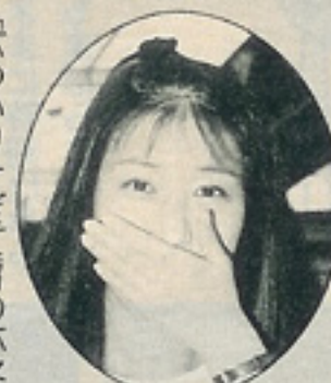
アツちゃん 愛車=アルトターボ