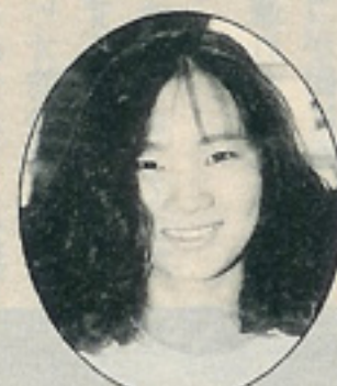
ミカちゃん ゼロハンライダー