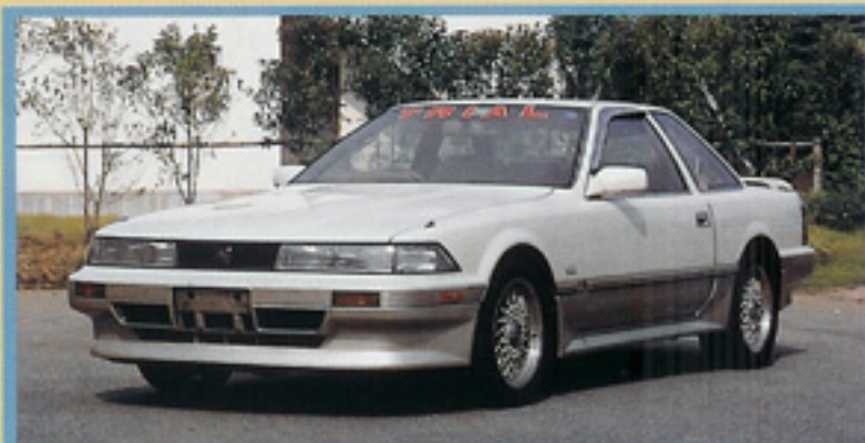
フロント回りはノーマルのままでなんの変更点もない

といえるほどのパワフルさとなり、チューニングカーの醍醐味が味わえる。思わず背中がシートのバックレストに、大きな加速Gのため、押しつけられるほどである。 マキシマムスピードにおいても、性能アップは著しく、272・934 km/h