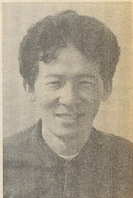
トータルな車作りでは定評のあるマインズの新倉社長。早くマインズ版のスーパーRが見たいノ