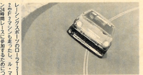
▲本命視されていたR9サマモトZ

この記録は、253km/hの記録は長くはかた。数々のうち、250.006km/hが出たのだ。これが、RE南宮の2つである。 このときの記録は、メカチューンによるもので、これ以後、本田のマキシマムスピードのトラナリ部においては、ターボが主役となる。2本のストレートを持つオーバルコースは、バンク内の速度は抵抗に下りある程口入させるし、コーナーと同じくなので、バンク内のスピードもへらへらと出まは出来な。このように条件がいくと、ハイパーとクルを一気にさせるターボの方が、バンク内でのスピードがからなくとも、ストレートに出たら加速すること、スピードは十分に引き出せるからた。