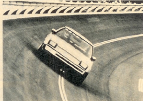
ツインターボ化により、速報に10km/hアップ。REパワーを知らしめた

この日、各都府にいた人達は、このペリサウンドに圧倒されたものだった。253km/hの記録は長くはかた。数々のうち、250.006km/hが出たのだ。これが、RE南宮の2つである。 このときの記録は、メカチューンによるもので、これ以後、本田のマキシマムスピードのトラナリ部においては、ターボが主役となる。2本のストレートを持つオーバルコースは、バンク内の速度は抵抗に下りある程口入させるし、コーナーと同じくなので、バンク内のスピードもへらへらと出まは出来な。このように条件がいくと、ハイパーとクルを一気にさせるターボの方が、バンク内でのスピードがからなくとも、ストレートに出たら加速すること、スピードは十分に引き出せるからた。