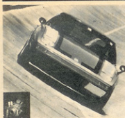
277.43km/hの南宮R X-7。快風撃中の頃