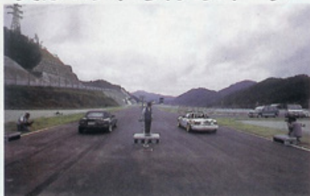
セントラルのワリはゼロヨン。それじゃってなワケでゼロヨンバトルの始まり。ロードスターのゼロヨンって珍しいでしょ。