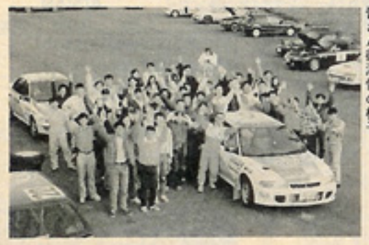
シロクマのボス・芽根社長を囲んで皆さん御満悦の様子。

30分という時間は初心者には長く感じられるようで、息切れをしていたドライバーも結構いたようだ。2トライ目には、ほとんどのドライバーがタイムを短縮。クルマを操る気持ちに余裕ができたようだった。