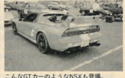
こんなGTカーのようなNSXも登場。