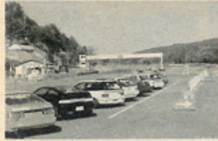
缶コーヒーを飲み終わってからスタートノ

愛知のアイメック主催の4時間耐久草レースが、岐阜の瑞浪モーターランドで11月25日に行われた。前回の7月に行われたレースではREV編集部チームも乱入(その模様はREV33年9月号を参照してね)、4時