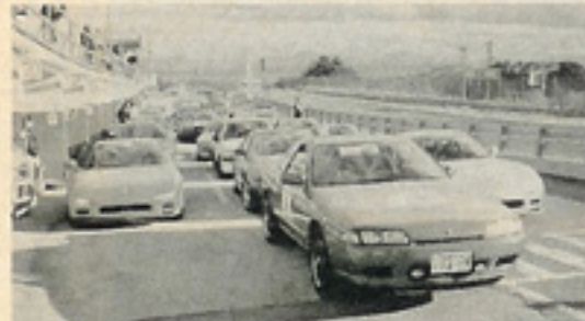
天候にも恵まれたたくさんさんのクルマが集結した。

12月4日にNSXクラブの走行会がエビス東コースで行われた。これは日頃から日光サーキットで走行会を行っているNSXクラブが、参加者へのお礼という意味を込めて走行会を行おうというもので企画されたものだ。そのため日光での走行会へ参加していたヒトに