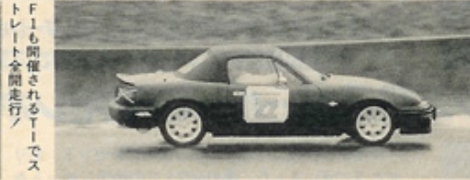
F1も開催されるT1でスレイト全開走行ノ