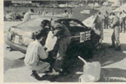
4時間も走るから途中で燃料の補給が必要。

間の長丁場のレースをメチャ楽しんだのだった。さて第2回の今回は、参加を募集する前から問い合わせが殺到だったというほどの大人気、おかげでキャンセル待ちで、やっとの思いで参加できるチームもあったほどらしい。自由に走れる走行会も楽しい。だけどバトルありのレース形式の走行会はさらに刺激もアップ、さらに楽しめるのがいいよね。参加車両は普段の街乗りに使っているナンバー付きもあれば、解体車、あるいはレーシングカーを持ち込んでいるチーム