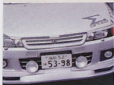
右のバランスも絶妙だ