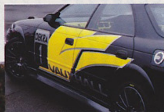
→メーターの白が 軽い気もするゾ