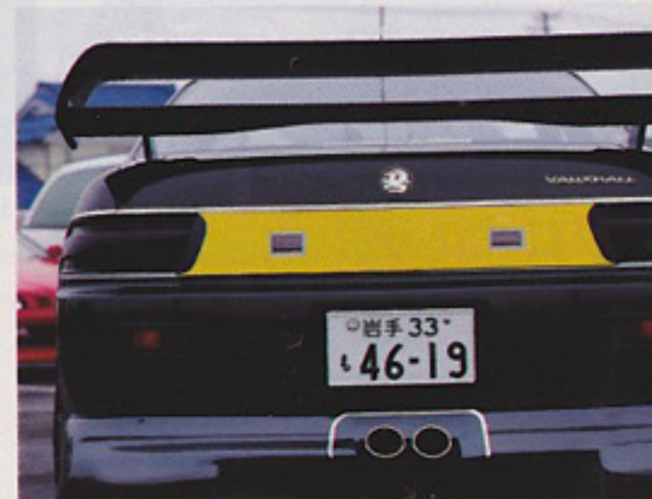
↑かなり強烈なりヤビュに演出されている

①フィズスポーツ・ヒッポススリーク ②ヒッポススリーク ③フィズスポーツ ④トライアル・GT-R用 ⑤ナルディ ⑥カロツツェリア ⑦レカロ・アク タイプ ⑧ポッシュ・ラリーストラダ ⑨ベルサス・セスト(7.5×18) ⑩ビレリP7000(215/40) ⑪タナベ・スーパーH ⑫HKS・スーパードラッグ +レムス ⑬ラファーガ・ダクト ツェンダー・フェーエルリッドカバー Gブランド・アイライン ボグソール・エンブレム 自作Rガーニッシュ/ボグ ルステッカー Dスピード・ミラー その他 ⑭レカロRシート張り替え インパネ各部塗装 大森3連メーター 自作ドア内張り張り替え その他