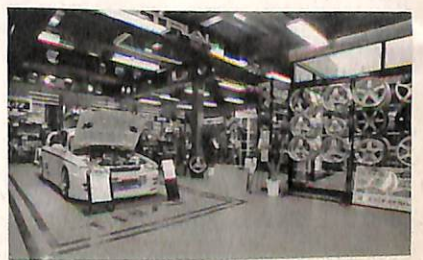
シヨールーム内。品揃えがすげえ。

トライアル:〒587-0011大阪府南河内郡美原町丹上87-1 ☎0723-69-3539