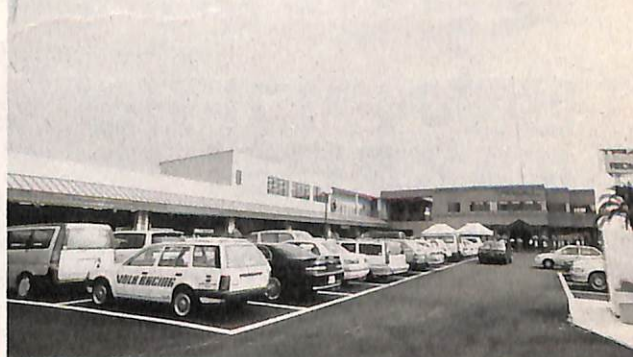
お店の外観。広すぎて、1枚の写真に収まりませんぞなもし。